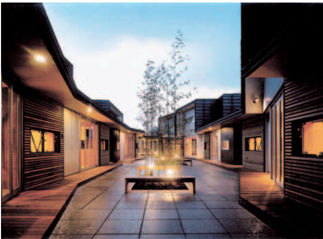
▲中庭（3階・宿泊施設）

3・4階には、外国人招へい研究者の長期滞在を支援し、共同研究を円滑に進めるための安全かつ快適な居住環境を提供できる宿泊施設があり、単身用3戸、夫婦用5戸、家族用2戸の計10戸が設けられています。全ての宿泊室の玄関と居間は、中庭に面しており、さらに、居間の中庭に面する部分のサッシは全面開放し、住人同士の交流が活発に図られるような設計になっています。