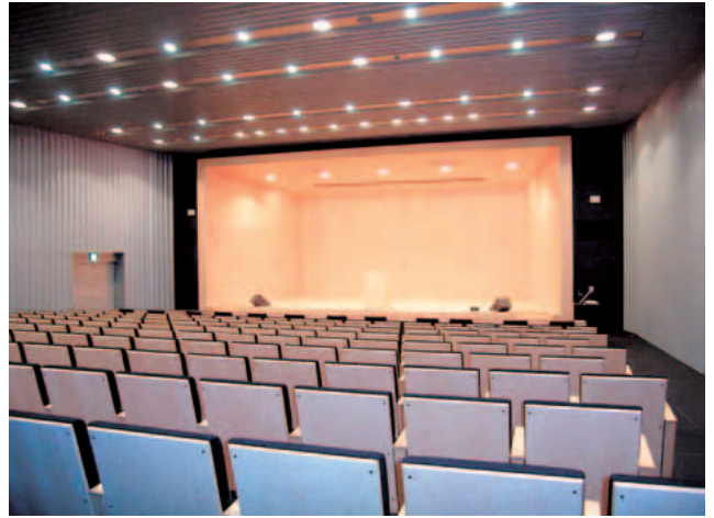
▲カンファレンスホール（2階）

「BINAP（不斉触媒）」からとられたものです。林の中に配置された同館の1階からは2層吹き抜けのガラス越しに林の木立が見られ、気持ちの良い空間となっています。